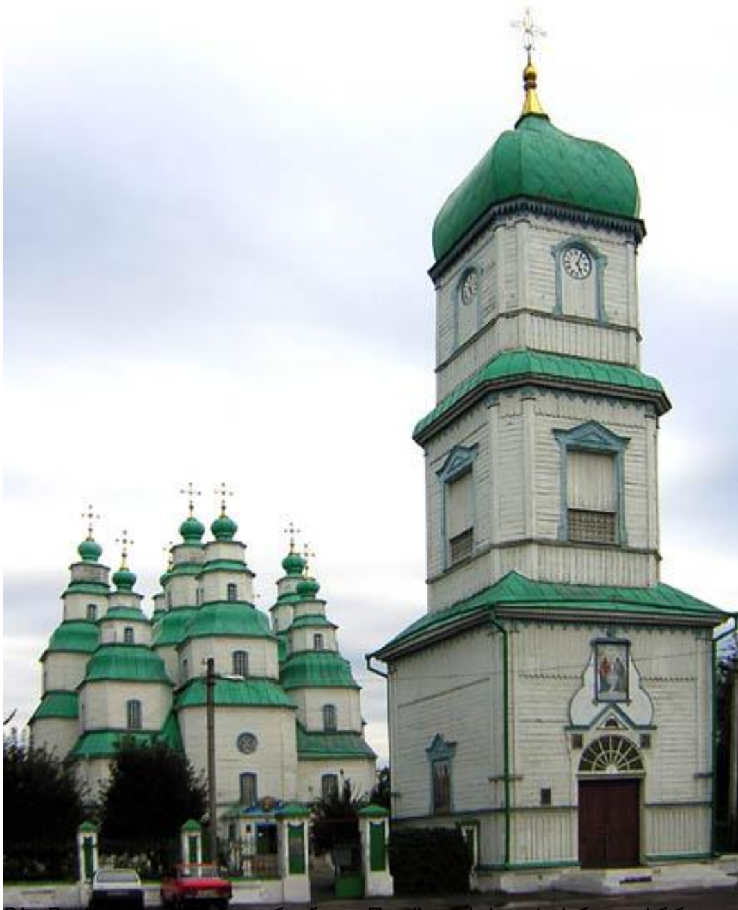
Вид Троїцького собору з боку дзвіниці, збудованої в 1816 році. Фотографія зроблена в 2016 році.